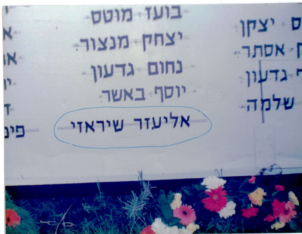
רשימות הנפלים בחצר ביה"ס תיכון "אורט נביאים"