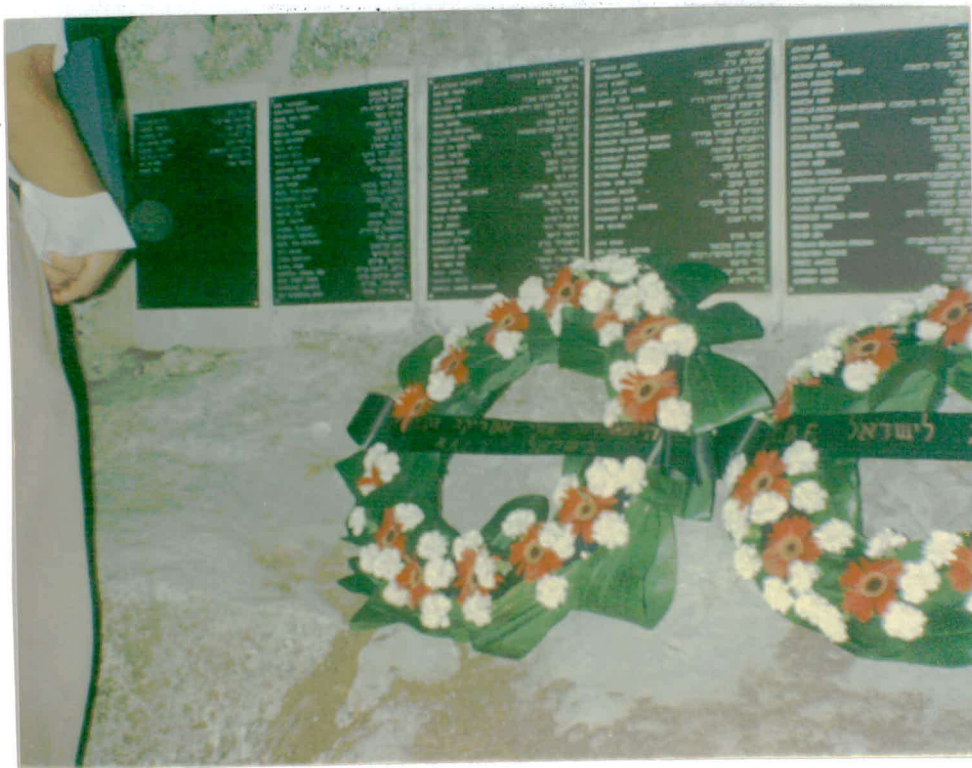
רשימות של הנפלים על הגנת מדינת ישראל. נעשו על ידי התאחדות עולי אמריקה וקנדה.