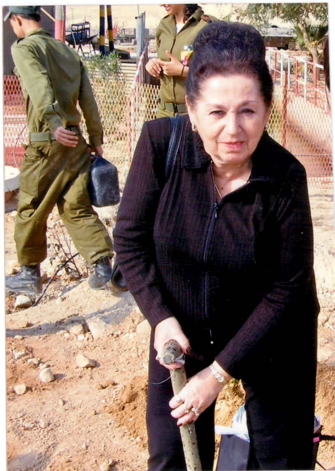
האמא בטקס נטיעות להנצחת חללי בית הספר למ"כים.