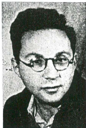
מנחם ריצמאן ז"ל

מנחם ריצמאן נולד בשנת 1924. ב-1935, והוא בן 11, עלה עם הוריו לארץ, ועד מהרה נקלט ונתערב בה בחברתם של בני-גילו. הוא לומד להכיר את הארץ, חש את התנ"ך בכל רגב מאדמתה, ובפרוץ מאורעות 1936 — חי את המציאות האכזרית הדורשת קרבנות-אדם. ברשימה, שפירסם בעתון בית-הספר, מדגיש הנער הקטן את קדושתם של החללים, ומציין, כי אלה מחייבים את הנשואים ללכת בדרכם. לא ידע, שכעבור 12 שנה, ייתבע גם הוא להקריב את חייו — וייענה.