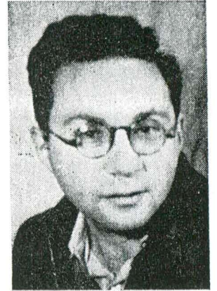
מנחם ריצמאן ז"ל

מנחם ריצמאן נולד בשנת 1924. ב-1935, והוא בן 11, עלה עם הוריו לארץ, ועד מהרה נקלט ונתערב בה בחברתם של בני-גילו. הוא לומד להכיר את הארץ, חש את התנ"ך בכל רגב מאדמתה, ובפרוץ מאורעות 1936 — חי את המציאות האכזרית הדורשת קרבנות-אדם. ב-שימה, שפירסם בעתון בית-הספר, מדגיש הנער הקטן את קדושתם של החללים, ומציין, כי אלה מחייבים את הנשאים ללכת בדרכם. לא ידע, שכעבור 12 שנה, ייתבע גם הוא להקריב את חייו — וייענה.