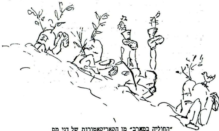
"החוליה במארב" מן הקאריקאטורות של דני מס

אישיותו, החיה עמנו כמופת של מפקד נאמן, תוסיף להדריך את רוח החטיבה גם בהיעדרו. [פלמ"ח, מס' 57-58, יאנואר 1948]