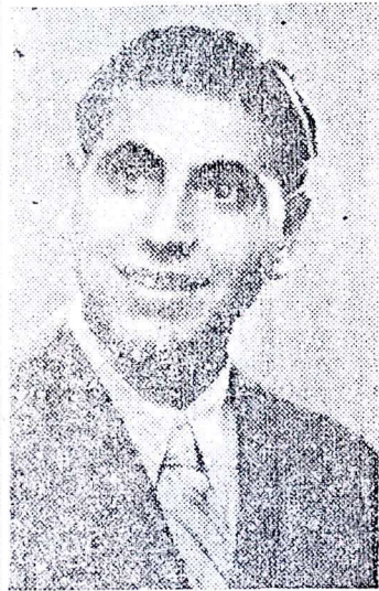
נפל בני תנוזת תש"ח

יוסף אני לסבלך אם עברית את שיללת בן יקר ואני — העבר יקר יודע אני כי רוב סבךך וגדול האומץ יודע אני כי גדלת את בנד בארצות ארץ ובדאגתך את שהשרשת את האויב חלל אומץ בלבך ונמך לטף לאהוב את מדי לדתו ; עת שהצטרף לאחיו הלוחמים שיצאו ללחום נגד המשעמך הבריטי ידע את אשר הוא עושה וככל אחיו הלוחמים לא היסס לילא את תפקידו כבן נאמן לעמו ולמולדתו. רבות הפי עומת בהן השתתף עוד הימי שלוחו האויב הבריטי במולדתו. מכילך חזר בריא בגופו ושמה על כי ניתנה לי ההודמנות להכות שליט הזר. ויותר מאוחר פולש הערבי. אך לא בפעולת קרב נפל, כי אם פגז האויב הפילג. רוחך היא שהדריכה אותך, אם עברית הוי גאה עליו. אל יאון ואל צער, כי יש שכר לפעלך; כי בן נאמן היה לעמו ולארצו. בבאות ציון וירושלים תמצאי נחמה ויידו בנפש