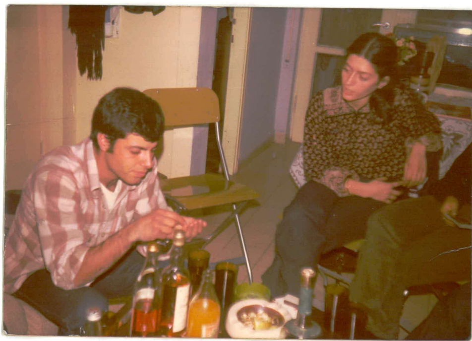
גזעון עם האושה - אסנה .