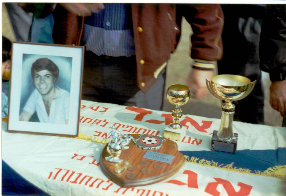
"אורניה" באט"ג עלכרו שם גזעון .