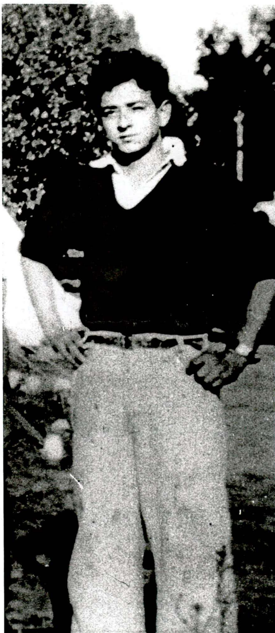
בן 15 (1945) 23 1945