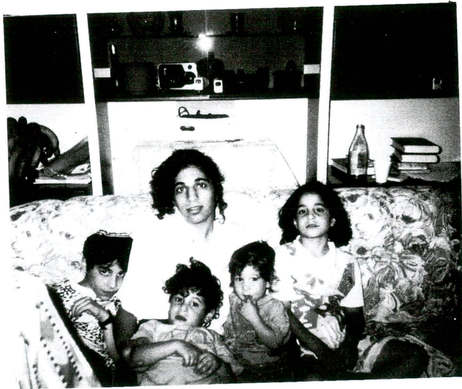
מרת' עס האמיינין