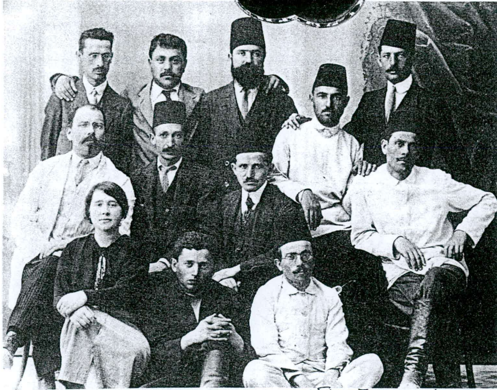
בן צבי וכן גוריון/צעת הגירוש מהארץ [אם אה?]

X1 התורכים בשורת גזרות קשות על היהודים: גירושים מן הארץ, איסור הציונות, גיוס תושבים יהודים ליחידות עבודה מקומיות, החרמת בהמות עבודה ותבואה במושבות, [הגליית החושבים היהודים החליטו] הגדודים היהודיים המתנדבים. עם הכיבוש נקבע בארץ שלטון צבאי בריטי, שנתמשך עד יולי 1920 - כשאל ארץ-ישראל הגיע הנציב העליון האזרחי הראשון (היהודי) ד"ר הרברט סמואל. [אם אה?]