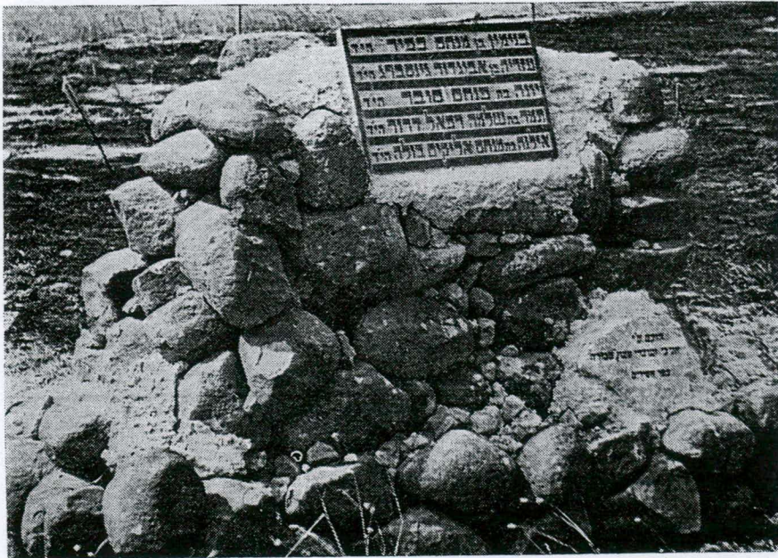
הגלעד הראשון. הוקם לזכר הנופלים, בשדות רמת-מגשימים