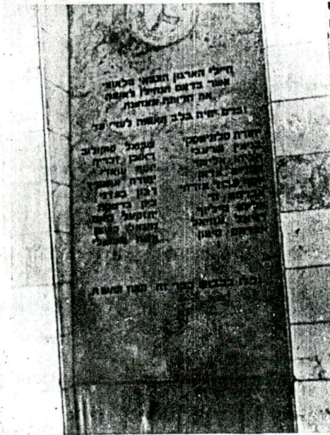
האנדרטה לנופלים במלחה.