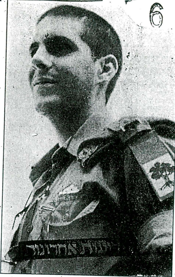
סגן דרור בראשי ז"ל