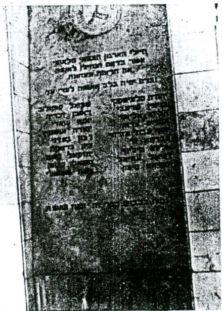
האנדרטה לנופלים במלחה.