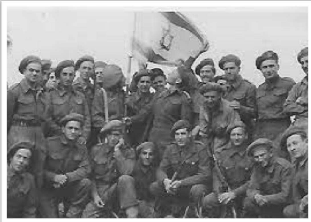
חיילי הבריגדה היהודית עם חברי תנועת הבריחה

חיילי הבריגדה היהודית של הצבא הבריטי שפגשו את הניצולים נעזרו במעמדם ובאמצעים שעמדו לרשותם לטובת אחיהם הניצולים. חלקם אף נשארו באירופה לאחר שיחרורם מ"הבריגדה" כדי להמשיך בפעילות. בהמשך נטל על עצמו המוסד העלייה ב' של ההגנה, שהוקם כדי לסייע ליהודים לעלות לארץ ישראל למרות האיסור שהטילו שלטונות המנדט הבריטי, את ניהול הבריחה. השליחים הארצישראליים של המוסד טוו רשת של נתיבים ומחנות מעבר על פני אירופה כולה. בסיועם ובהנהגתם הפכה תנועת "הבריחה" לאחד הגורמים החשובים במפעל העלייה לארץ ובמאבק להקמתה של מדינת ישראל.