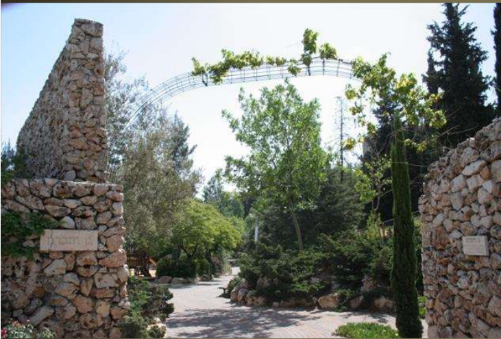
גן הזיכרון בירושלים

כיום, מונצח מרדכי ראובני רובין באנדרטאות רבות: