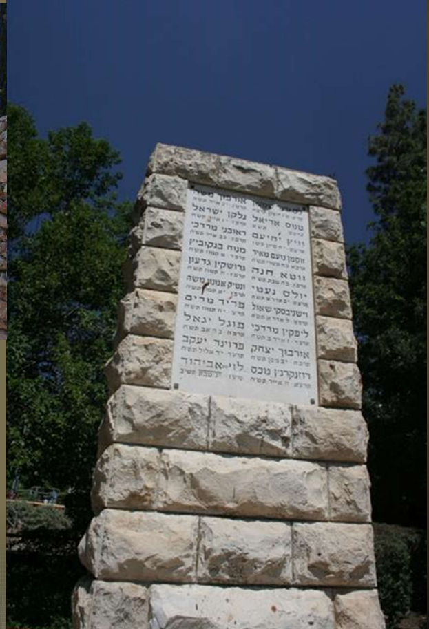
גן העשרים בירושלים