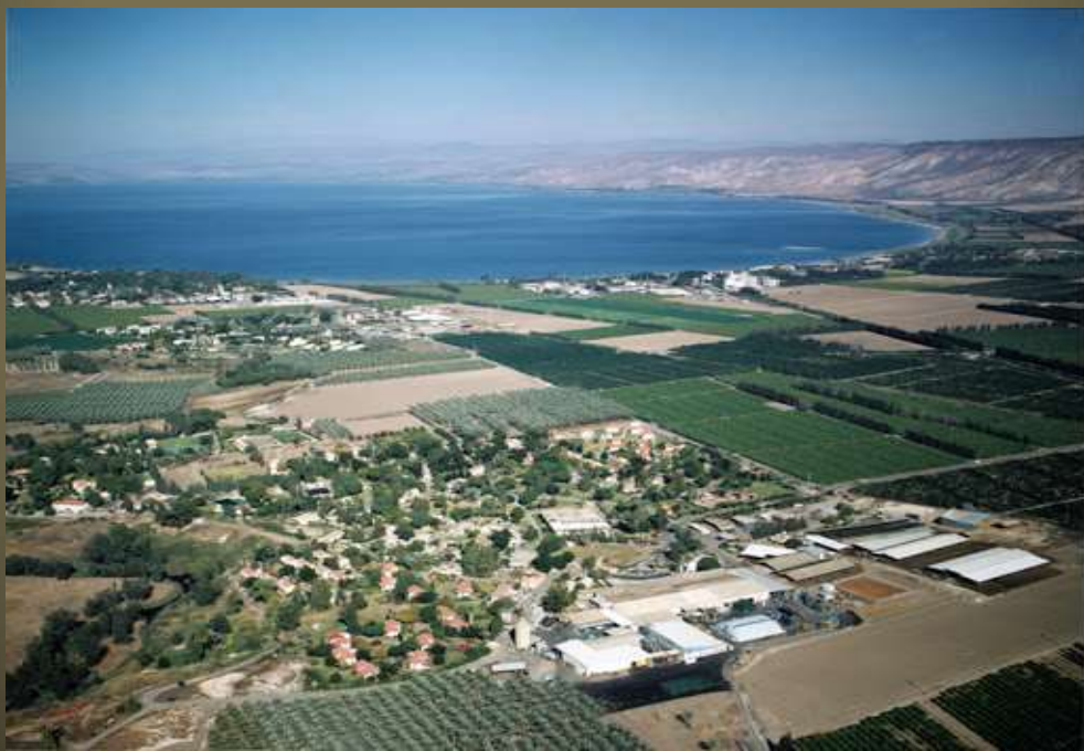
קיבוץ בית זרע- בקעת הירדן