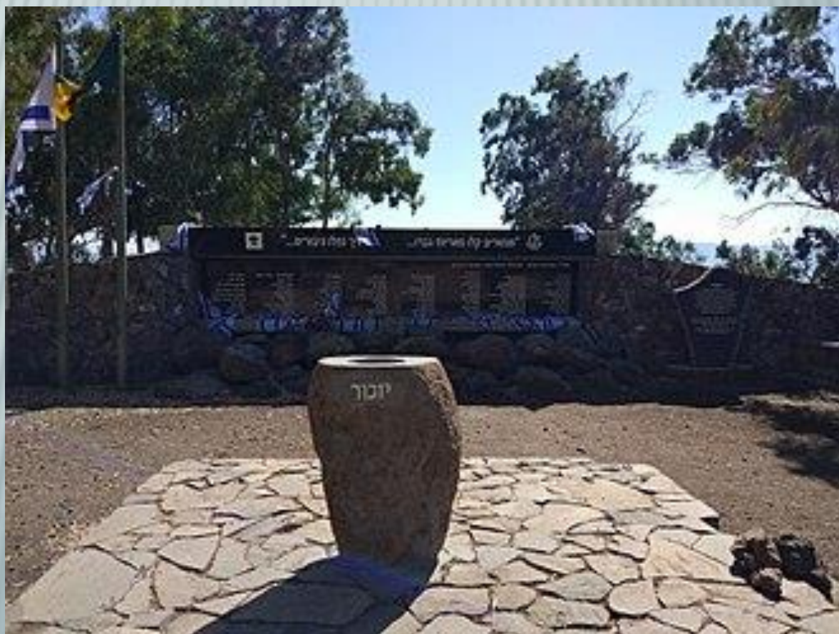
האנדרטה המרכזית שהוצבה במקום במלאת 50 שנה למלחמה

ככל הנראה הסיבה לכך שהפגיעה בנפש ובגוף היתה כה גדולה היא העובדה שהקרב נערך בניגוד לתוכנית המקורית, ועל כן מהלכים אחדים בו השתבשו ונכשלו.