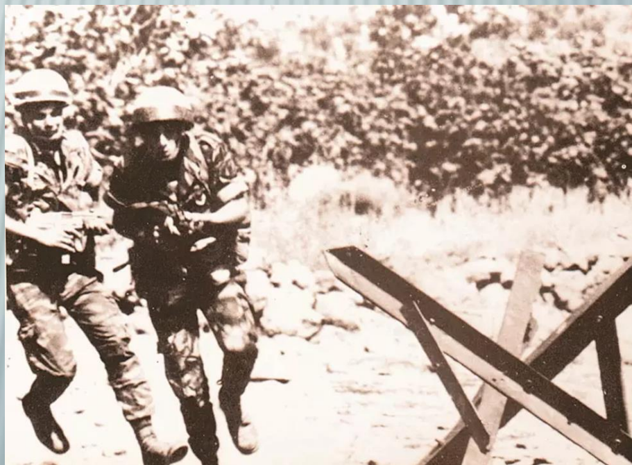
חיילים בקרב תל פאחר

לבסוף החיילים עלו לעמדות ירי בגבעה סמוכה וירו מספר פגזים על תל פאחר.