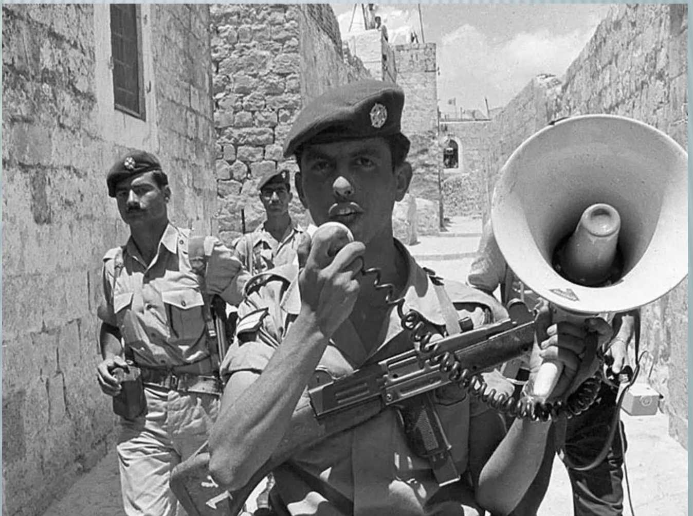
שוטרי מג"ב מכריזים על עוצר במהלך מלחמת ששת הימים.