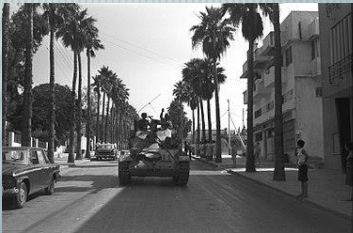
טנק ישראלי ברחוב בטבריה, בדרכו לקרבות ברמת הגולן