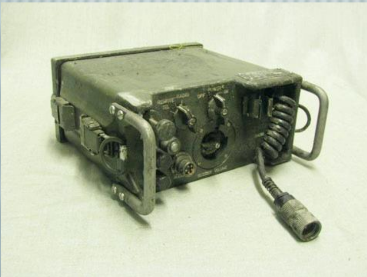
מכשיר קשר צהלי

צה"ל יצא למבצע השמדת חיילי האויב של מצרים, ירדן וסוריה. בשעה 8:15 נשמע בקשר מילת הקוד 'סדין אדום' וצה"ל פתח במתקפה אל עבר הצבא המצרי בחצי האי סיני וברצועת עזה.