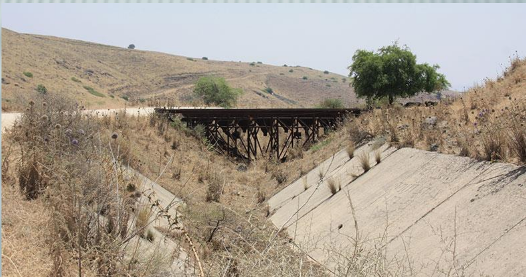
חלק מתעלת ההטיה בימינו.

לשם כך היה עליו לנוע על דרך העפר של אורך תעלת ההטיה הסורית עד לכפר עין א-דיסה ושם לעזוב את הדרך ולעלות עד לציר הנפט שממזרח, ולהמשיך עליו צפונה אל עורף המוצב.