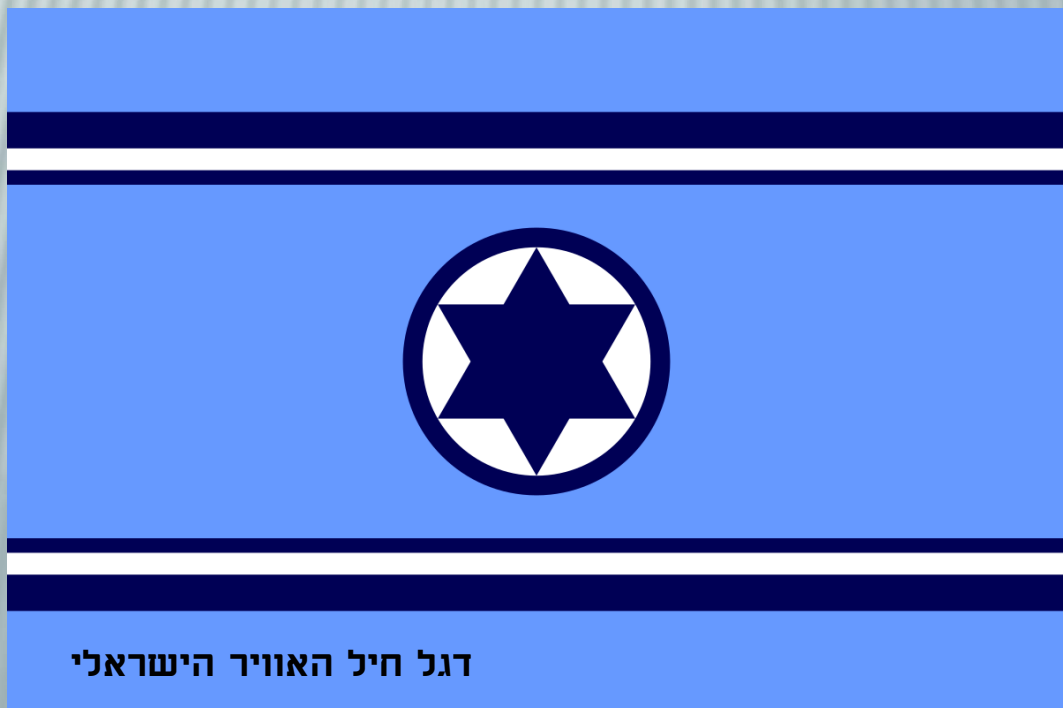
דגל חיל האוויר הישראלי

חיל האוויר הישראלי הנחית מכה אווירית, כמעט בו זמנית, על כל שדות התעופה המצרים וכתוצאה מכך חיל האוויר המצרי שותק כמעט לגמרי למשך שארית המלחמה. מיד לאחר המכה הראשונה, הותקפו גם שדות התעופה של חיל האוויר הסורי וחיל האוויר הירדני והופצץ גם שדה התעופה העיראקי המערבי ביותר.