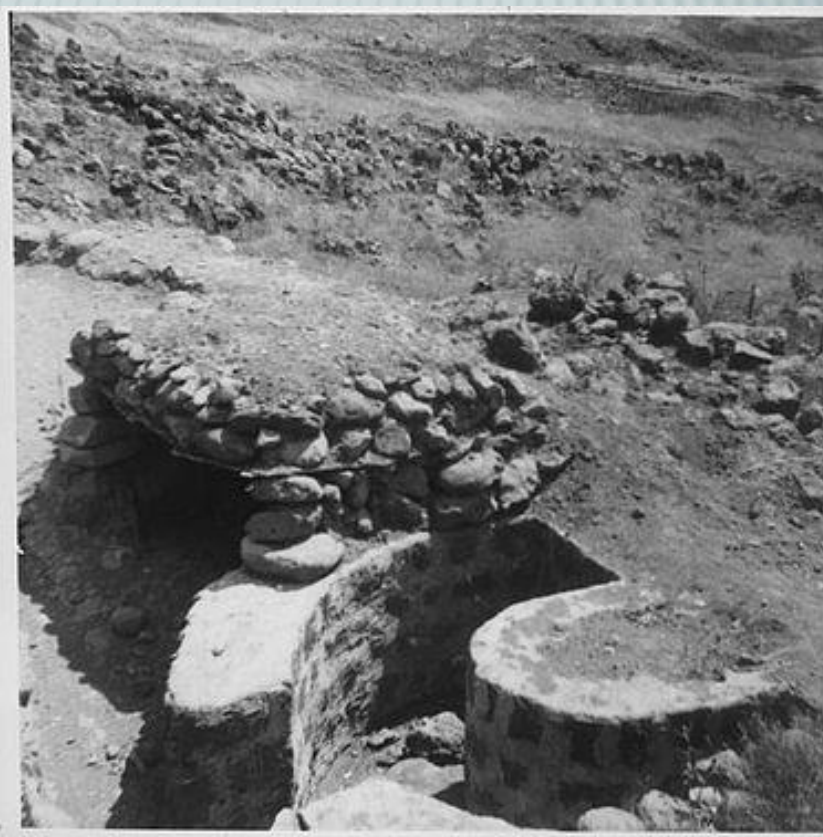
מבט ממצדית בחלק הצפוני של תל פאחר

העלייה לרמת הגולן בכוחות גדולים אפשרית רק במספר קטן של צירים עיקריים, ומערך המוצבים שתל פאחר היה חלק מהם, שלט באופן מוחלט על ציר העלייה הצפוני ביותר.