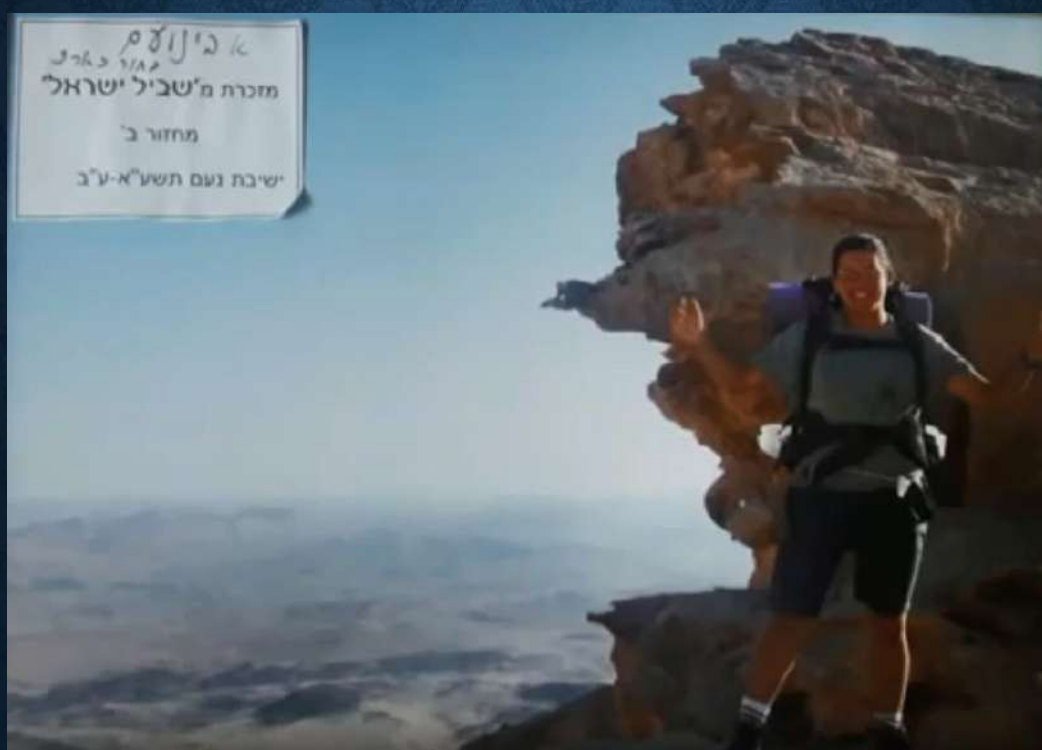
מזכרת שאבינועם חילק באחד הטיולים בשביל ישראל